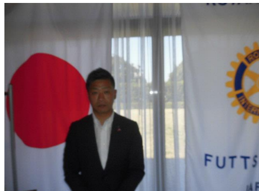
本日の卓話について