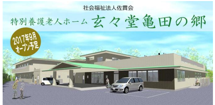
特別養護老人ホーム 玄々堂亀田の郷について